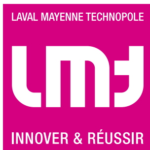
Logotype sur fond blanc

1 / UTILISATION : le logotype LMT doit être utilisé en rose sur un fond blanc ou clair, et en blanc sur un fond sombre ou une photo pour une meilleure lisibilité. Pour une impression professionnelle, il conviendra de toujours utiliser les fichiers du logotype au format vectoriel (.eps ou .ai) .