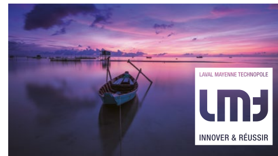
Logotype sur une photo

2 / TAILLE MINIMALE : le logotype LMT ne peut-être utilisé dans une taille inférieure à 15 x 15 mm ou, pour une utilisation digitale, 100 x 100 pixels .