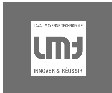
Logotype sur fond sombre